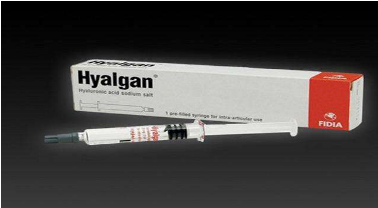
Hyalgan – Thuốc tiêm thoái hóa đốt sống cổ

Bên cạnh đó, thuốc tiêm đốt sống cổ Hyalgan còn được dùng trong phẫu thuật chỉnh hình. Bởi một số chuyên gia đã cho rằng loại thuốc này có khả năng ngăn chặn và bảo vệ tình trạng thoái hóa đốt sống cổ.